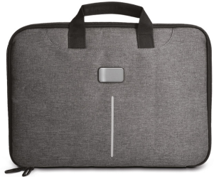
35 / Noir